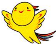
兵庫県マスコット「はばタン」