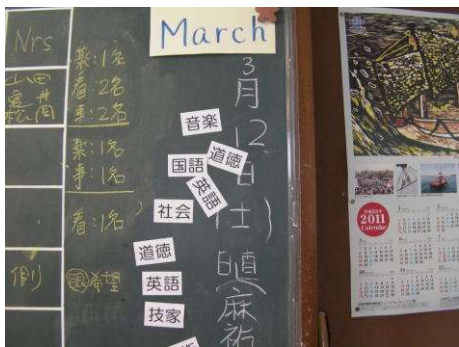
石巻中学校の黒板。