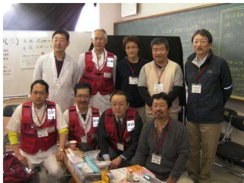
医師会チームの引き継ぎ。交代要員は、5名。